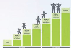
MAPAS DEL PROGRESO