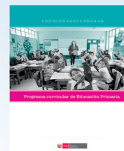
PROGRAMA CURRICULAR DE EDUCACIÓN PRIMARIA