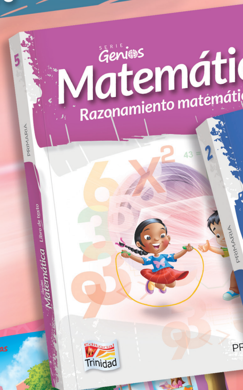
LÁMINA DIDÁCTICA A TODO COLOR POR CADA UNIDAD

Los niños recibirán, como complemento del texto, un CD elaborado con la más moderna pedagogía interactiva virtual.