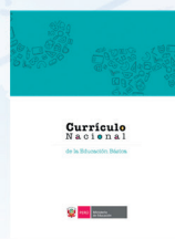
DISEÑO CURRICULAR NACIONAL de Educación Básica Regular

Nuestros materiales educativos incluyen los lineamientos pedagógicos: